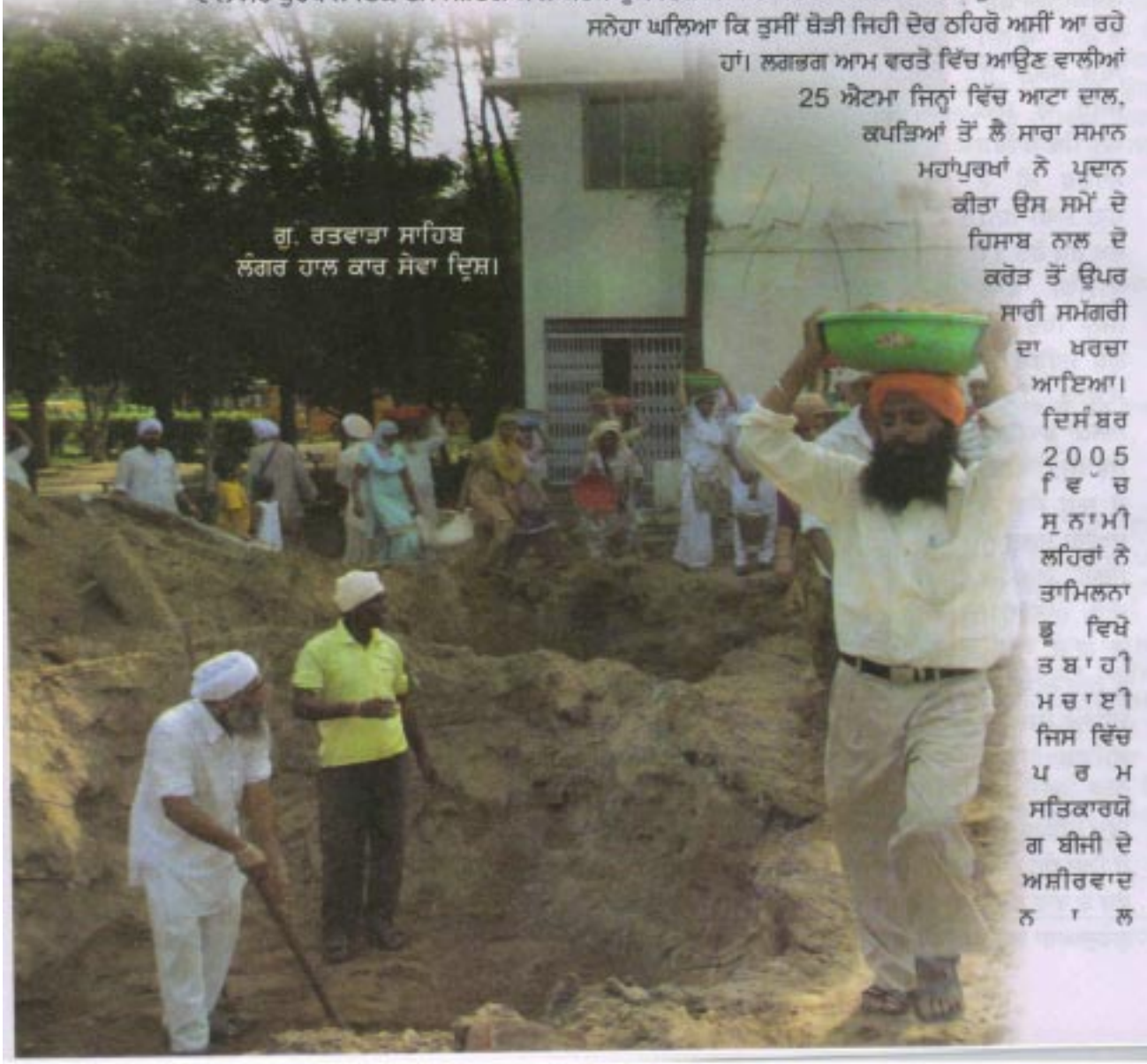
ਗੁ. ਰਤਵਾੜਾ ਸਾਹਿਬ ਲੰਗਰ ਹਾਲ ਕਾਰ ਸੇਵਾ ਦ੍ਰਿਸ਼।